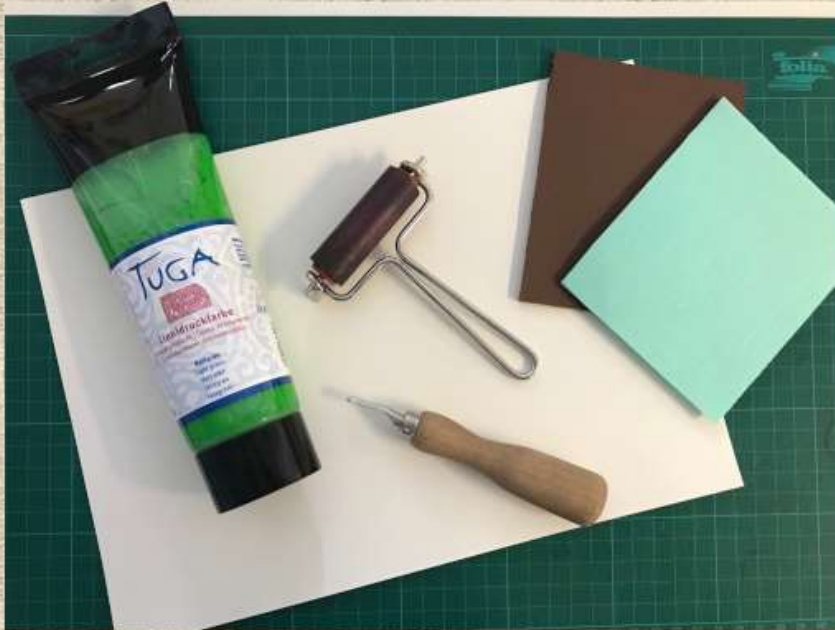
Linol- oder Styrodurplatten